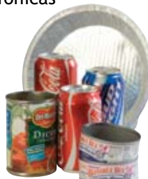
Latas de aluminio y hojalata