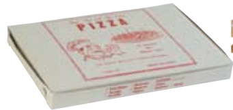
Cajas de pizza (vacías)