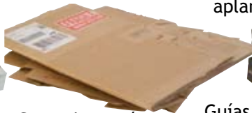
Cajas de cartón aplanadas