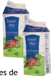
Envases de cartón de leche y jugo