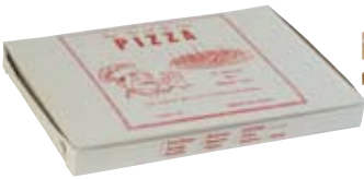
Cajas de pizza (vacías)