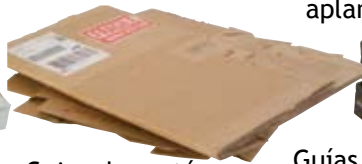
Cajas de cartón aplanadas