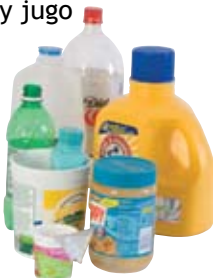
Cualquier recipiente de plástico