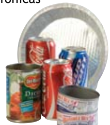
Latas de aluminio y hojalata