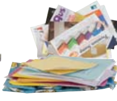
Correo basura, papel de color