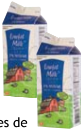
Envases de cartón de leche y jugo