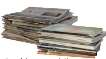
Periódicos con folletos, revistas y catálogos

Ahora puede mezclar todos estos materiales en su carrito o recipiente de reciclaje. Pueden dejar ventanas plásticas, grapas, clips (sujetapapeles) y espirales. Acuérdense de lavar las latas, botellas y frascos. Puede dejar las etiquetas y las tapas.